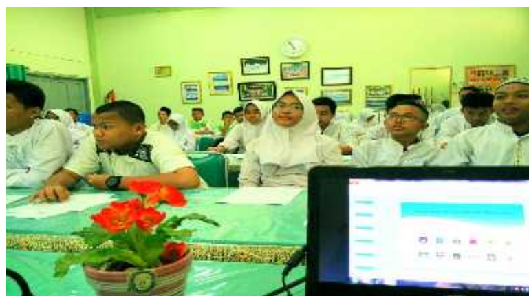
Gambar 5. Siswa-Siswi OSIS Peserta Penyuluhan.