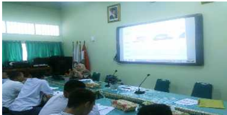
Gambar 3. Penyampaian materi penyuluhan oleh Dosen FHUY : Lusy Liany, SH.MH.