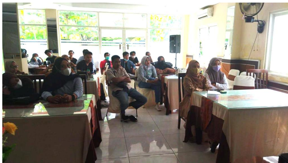
Gambar 1. Pelaksanaan sosialisasi website desa

Evaluasi dan masukan dari para peserta di kegiatan pengabdian ini yaitu kegiatan ini sangat menambah pengetahuan masyarakat. Yakni bertambahnya pengetahuan mengenai website dan media online . Perangkat desa juga mengharapkan kegiatan seperti ini dapat terus berlanjut demi peningkatan ekonomi masyarakat Desa Paddinging.